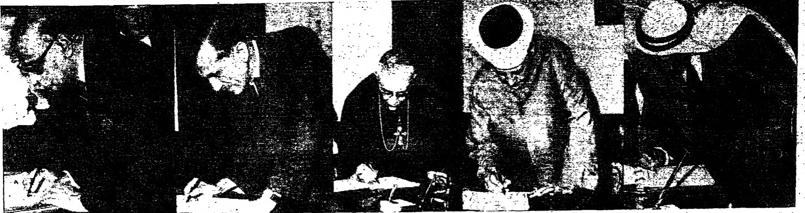
خمسة مشاهدين من زيارة المواطنين للديوان الملكي العامر وتسجيل اسمائهم ببطاقة من قبل سمو الأمير حسن ولي العهد المعظم الى سمو الاميرة ثروة كرام الله . ويرى من اليمين السيد كمال عرفات رئيس مجلس النواب والسيد الشيخ عبد الله غوشه ناضي القضاة ضيفه الطهران نعمة السمعان مغران اللذين قاما بتسجيل اسمائهم في جوازات تصوير دائرة السينما والتلفزيون في وزارة الاعلام .